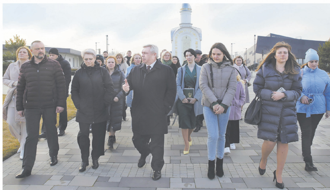
Василий Голубев с семьями участников СВО почтили память всех воинов, отдавших жизнь за Отечество

– Президент поручил на всех уровнях принимать дополнительные меры по увековечиванию памяти наших сегодняшних героев, – сказал Василий Голубев. – И мы понимаем, что эта работа для нас – навсегда.