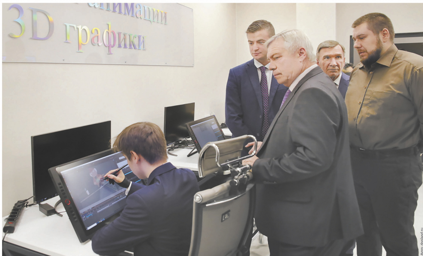
У Ростовской области есть все необходимое для технологического рывка, создания новых производств, выстроена система поддержки инвесторов и подготовки кадров для профессий будущего. Для того чтобы движение продолжалось, важно работать в единстве

Кроме того, в области действует развивающаяся система поддержки инвесторов. В этом году было заключено первое соглашение о защите и поощрении капиталовложений по инвестпроектам на сумму более 160 млрд рублей. Этот новый инструмент позволяет гарантировать неизмен-