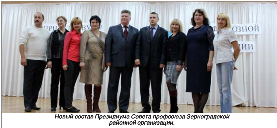
Новый состав Президиума Совета профсоюза Зерноградской районной организации.

В 2014/2015 учебном году в районной образовательной сети функционирует 45 образовательных организаций в т.ч. 26 дошкольных образовательных учреждений, 17 средних общеобразовательных учреждений, 1 основная общеобразовательная школа (9-летка), 1 учреждение дополнительного образования детей - Дом детского творчества «Ермак».