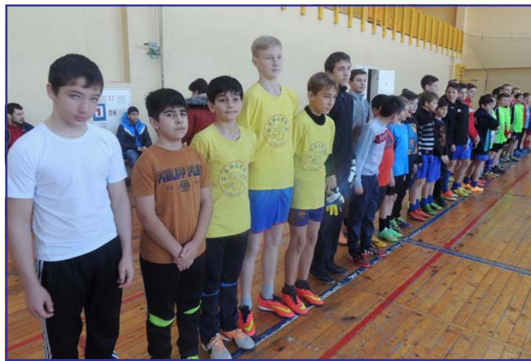
Кубка «Открытие сезона» 2015 года по волейболу среди команд г.Зернограда. Соревнования

стали открытием стартующего с 24 января Чемпионата Зерноградского района по волейболу. Победителем Кубка стала команда «Энергия» г. Зерноград, ей вручен диплом и Кубок. Специальными призами награждены лучшие по амплуа игроки (лучший разыгрывающий, лучший игрок, лучший нападающий).