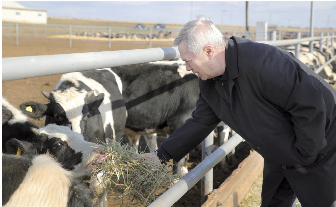
Развитие всех направлений сельского хозяйства одинаково важно для региона

– На протяжении десяти лет на эти цели направляется не