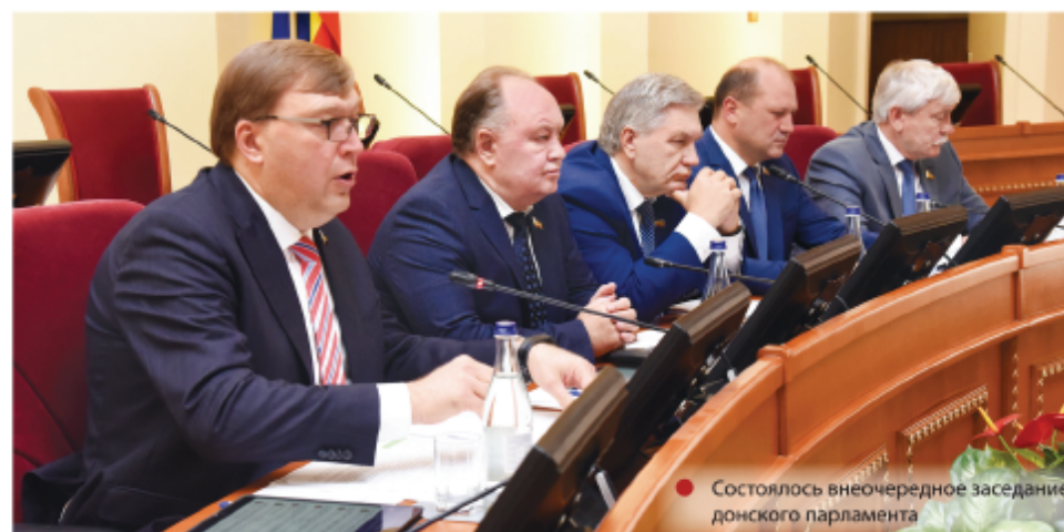
Состоялось внеочередное заседание донского парламента

ращение к Председателю Государственной Думы Вячеславу Володину по поводу гарантий прав ребенка на качественное, безопасное и здоровое питание.