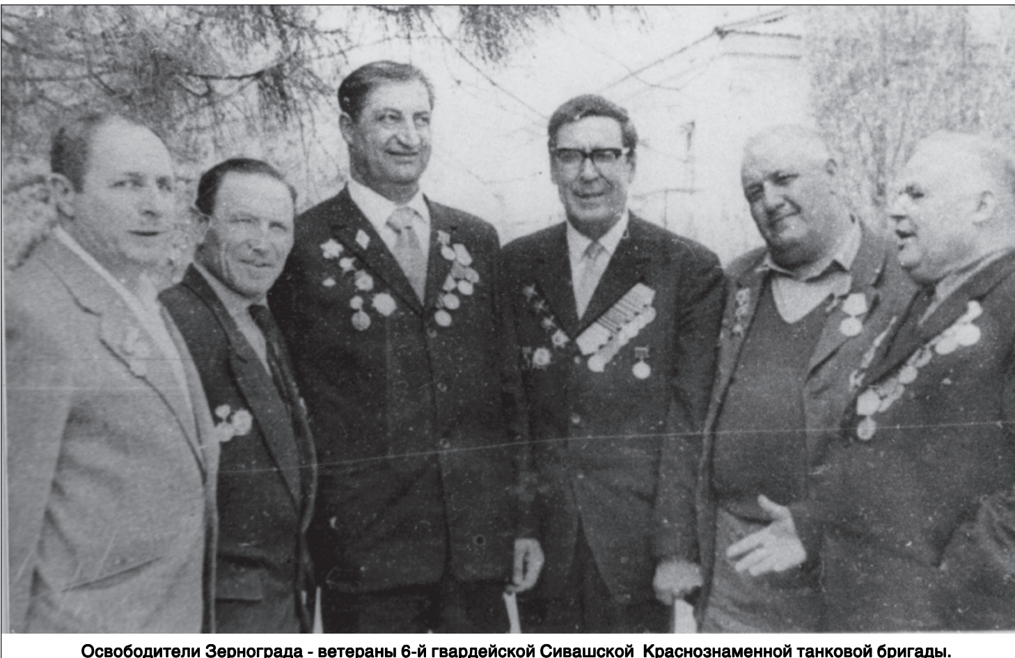
Освободители Зернограда - ветераны 6-й гвардейской Сивашской Краснознаменной танковой бригады.