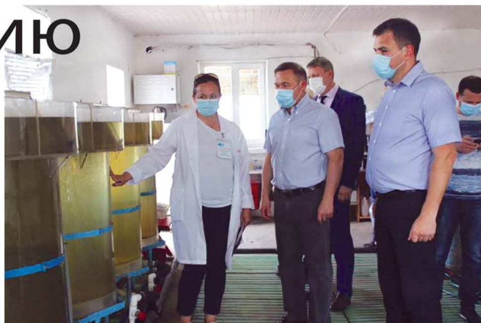
реализовать соответствующую государственную программу.