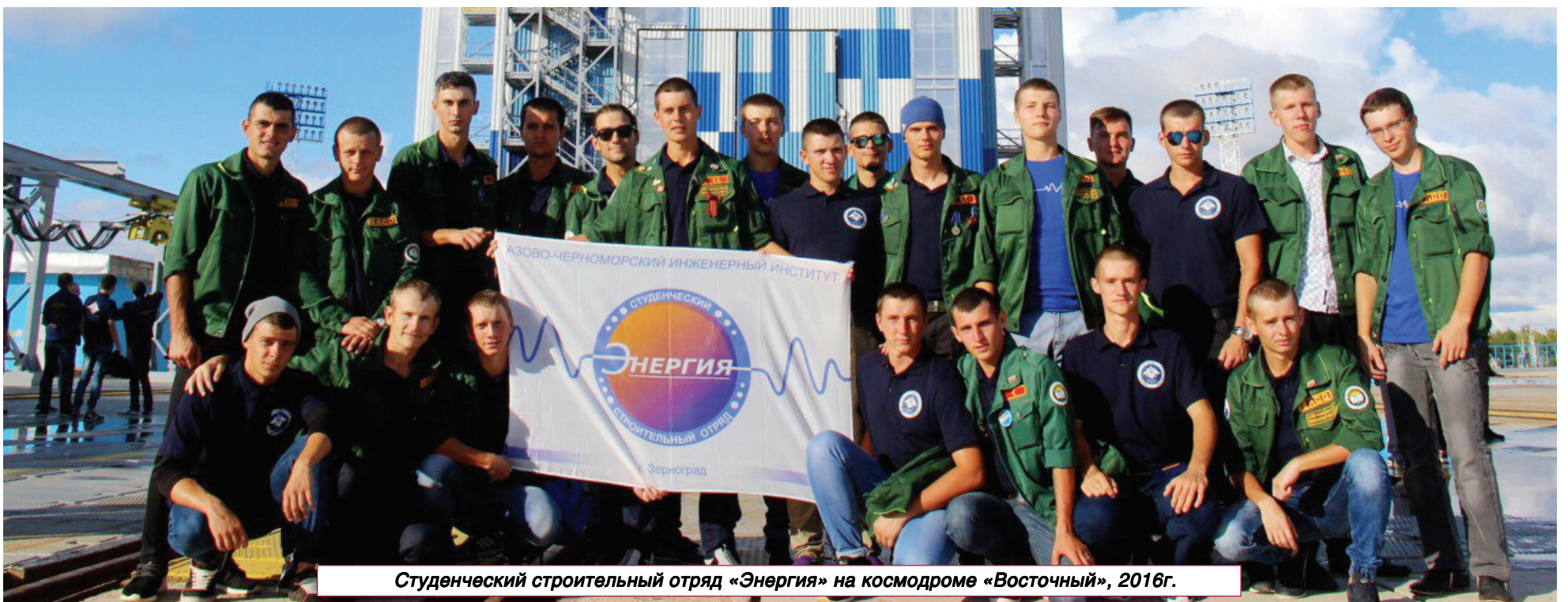
Студенческий строительный отряд «Энергия» на космодроме «Восточный», 2016г.