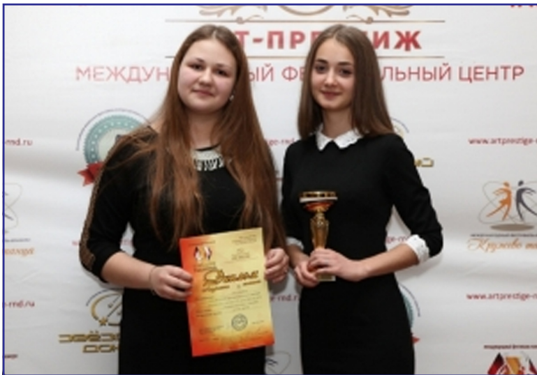
4-6 декабря в Ростове-на-Дону проходил I Международный фестиваль-конкурс детского и юношеского творчества «Поколение талантов».