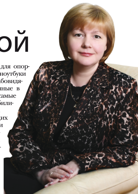
● Министр труда рассказала о создании комфортных условий для инвалидов