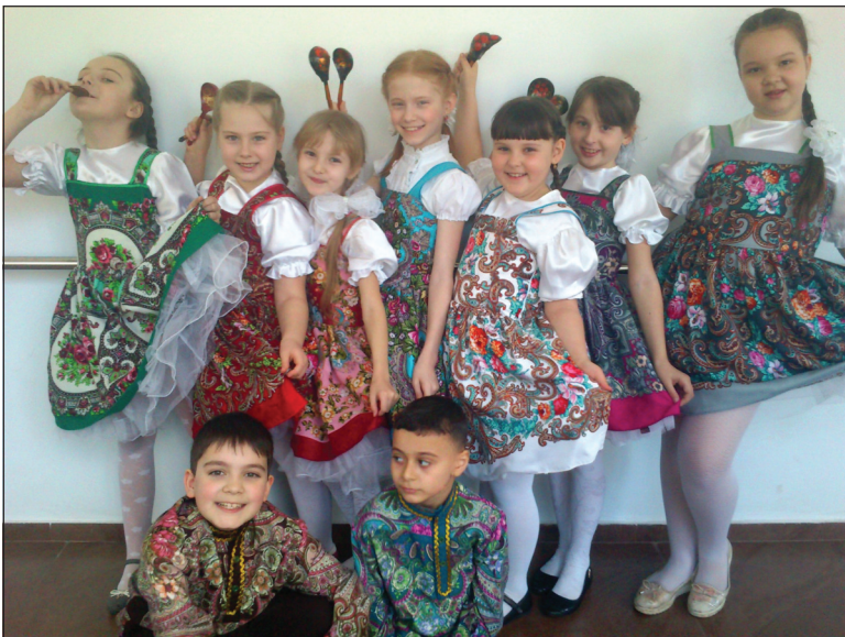
Двадцать третьего марта в станции Егорлыкской проходил региональный конкурс ансамблевой музыки «В третье тысячелетие - с надеждой».

В этом конкурсе попробовал свои силы ансамбль ложкарей "Русские узоры" из дома детского творчества "Ермак" зерноградского района.