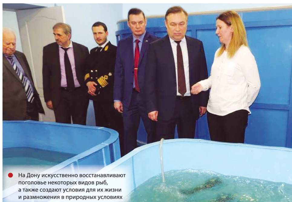
● На Дону искусственно восстанавливают поголовье некоторых видов рыб, а также создают условия для их жизни и размножения в природных условиях

Но несмотря на положительную динамику в развитии рыбохозяйственного комплекса Дона, существуют и проблемы, оказывающие серьезное сдержива-