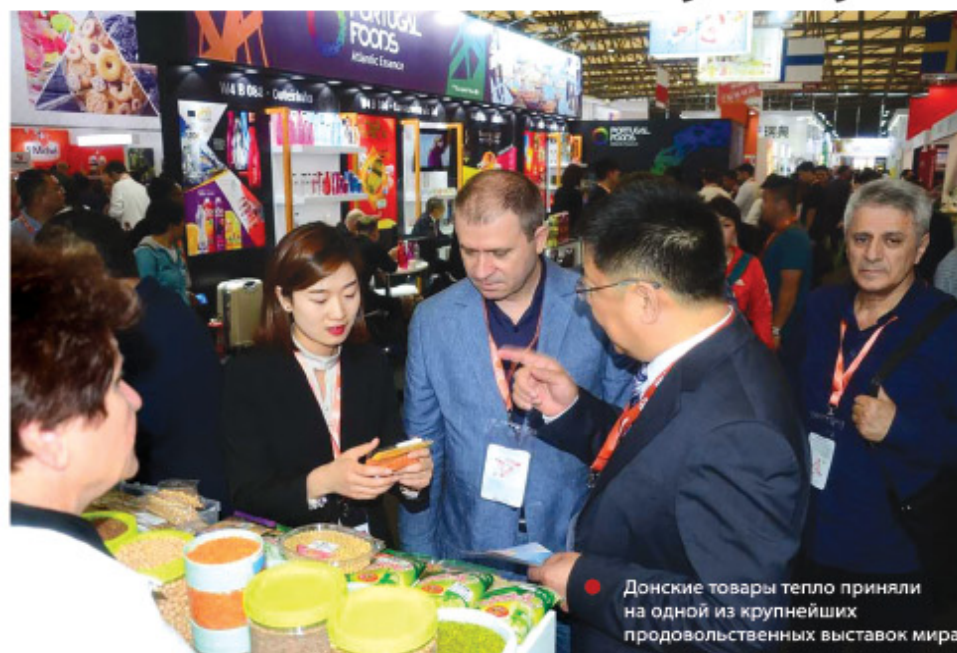
Донские товары тепло приняли на одной из крупнейших продовольственных выставок мира

Но «СИЯЛ ЧАЙНА» – это не только возможность продемонстрировать достижения, это еще и площадка для