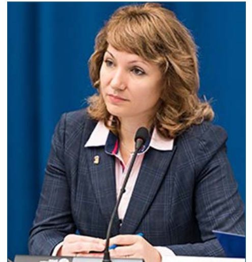
Л.Н.Тутова, депутат Государственной Думы ФС РФ.

Основной перечень льгот многодетным семьям гарантирует Указ Президента