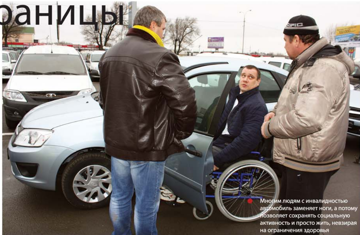
Многим людям с инвалидностью автомобиль заменяет ноги, а потому позволяет сохранять социальную активность и просто жить, невзирая на ограничения здоровья

Но некоторым категориям жителей Ростовской области «социальное такси» может и не понадобиться, потому что у них есть свой собственный специализированный транспорт. Накануне Международного дня инвалидов