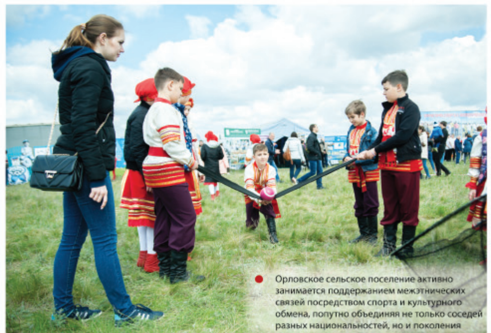
Орловское сельское поселение активно занимается поддержанием межэтнических связей посредством спорта и культурного обмена, попутно объединяя не только соседей разных национальностей, но и поколения

– С помощью этого калькулятора, который расположен на сайте администрации города, можно увидеть, сколько времени займет каждая процедура, какие документы понадобятся для начала индивидуального или многоквартирного строительства, – пояснил первый зам-