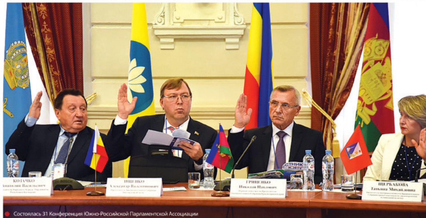
Состоялась 31 Конференция Южно-Российской Парламентской Ассоциации

После принятия в 2006 году федерального закона о розничных рынках они оказались в более жестких, даже дискриминационных условиях работы относительно других форматов торговли. В итоге число таких рынков в стране сократилось в 6 раз – до 1002, в Ростовской области в 4 раза – до 55. «Розничные рынки выполняют важную социальную функцию. Через них жители получают возможность покупать свежие продукты. Сокращение количества рынков также ударило по крестьянам, по самозанятым. По сути, владельцы подсобных хозяйств утратили легитимный канал реализации своей продукции», – заявил председатель комитета