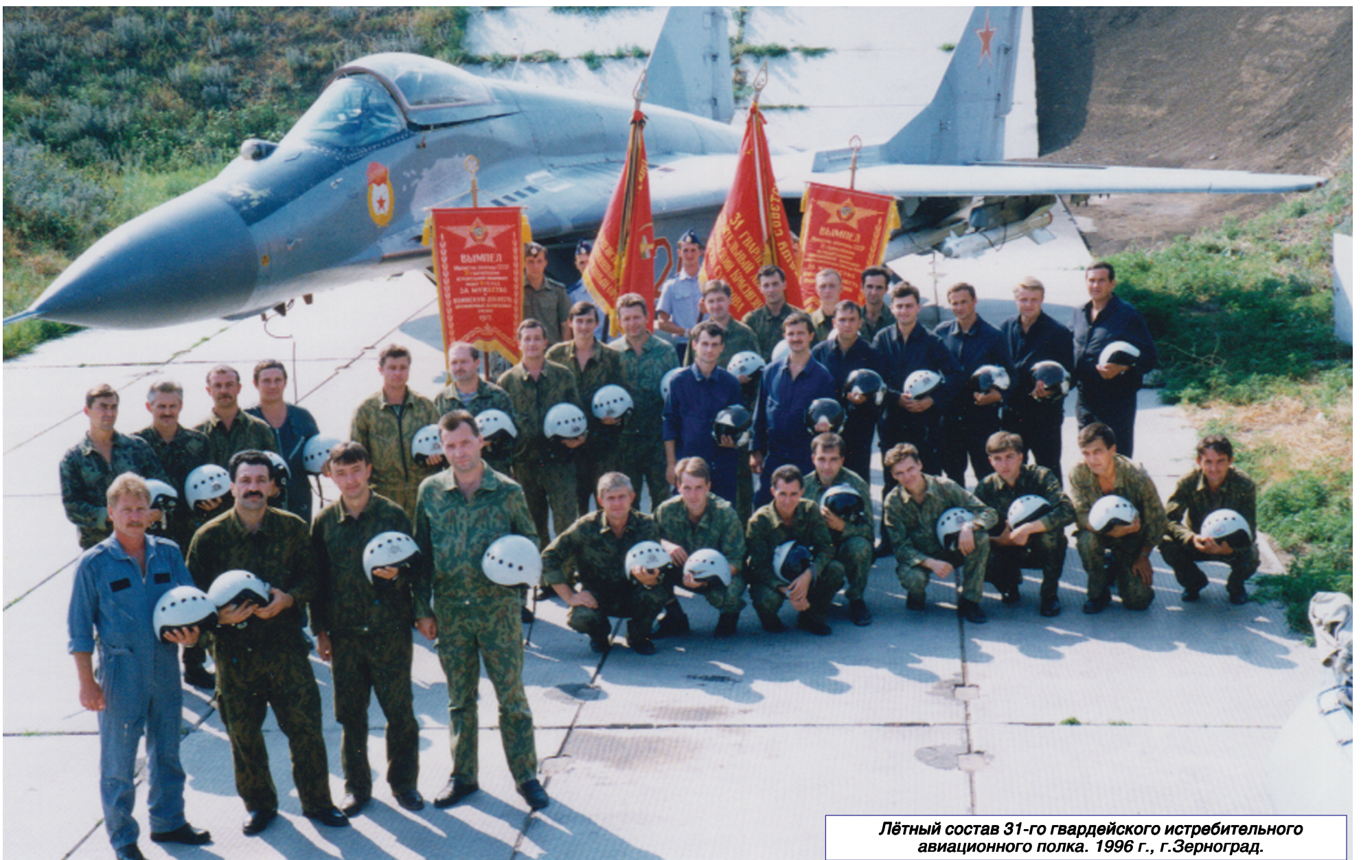
Лётный состав 31-го гвардейского истребительного авиационного полка. 1996 г., г.Зерноград.