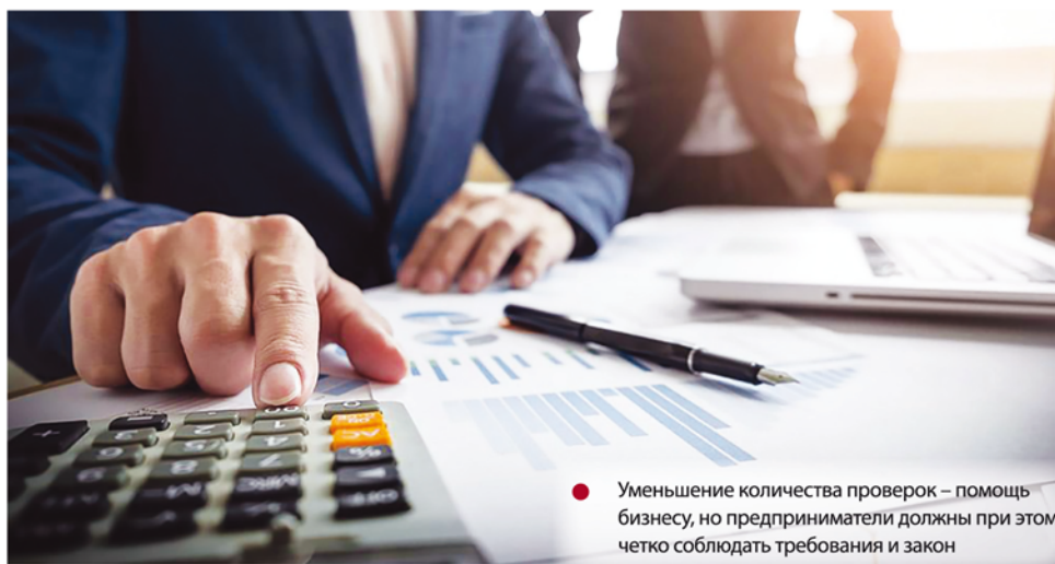
Уменьшение количества проверок – помощь бизнесу, но предприниматели должны при этом четко соблюдать требования и закон

В этом году донские предприниматели застрахованы от одного из стрессов – проверок. Решением губернатора они запрещены до начала 2021 года. Но внеплановые проверки, основанием для которых являются причинение вреда жизни, здоровью граждан, возникновение ЧС природного и техногенного характера, проверки, результатом которых является выдача разрешений, лицензий и т.д. – сохраняются.