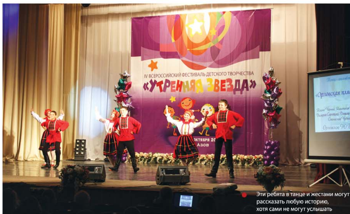
Эти ребята в танце и жестах могут рассказать любую историю, хотя сами не могут услышать

Награжденных по итогам фестиваля в этом году было много. Жюри пришлось потрудиться, чтобы выбрать лучших – подготовка конкурсантов была достойной. В номинации «Клоунада» жюри решило не присуждать первые места, а третье досталось