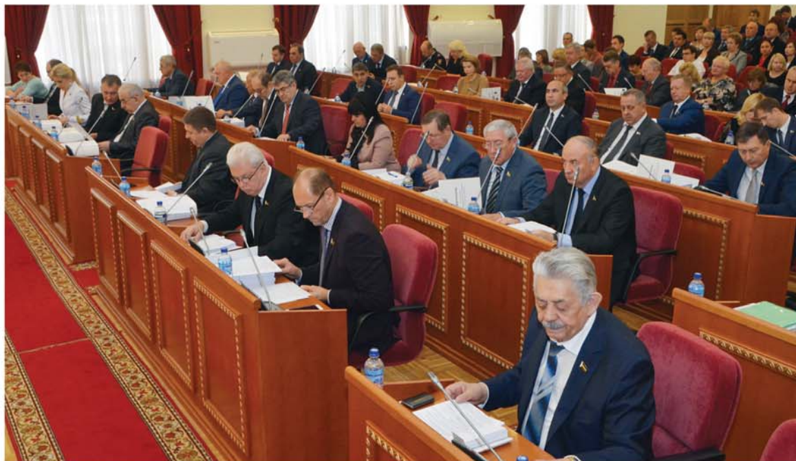
● Состоялось очередное заседание Законодательного Собрания Ростовской области

На заседании ЗС принят новый областной закон – «О развитии библиотечного дела в Ростовской области». В законе определены приоритетные на-