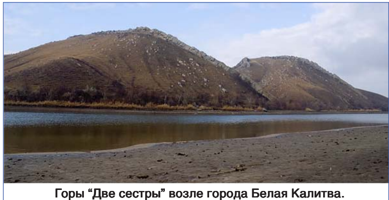
Горы "Две сестры" возле города Белая Калитва.

М.АЛЕКСАНДРОВА.