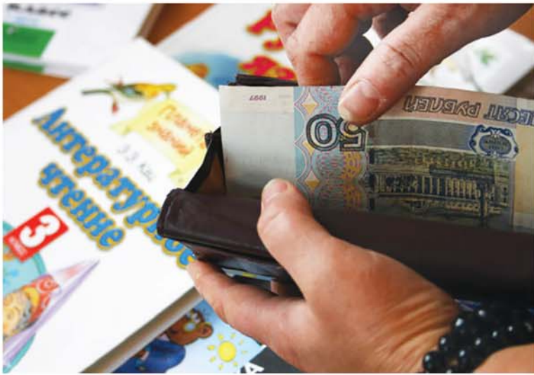
● 33 000 бюджетников поднимут зарплату уже в этом году