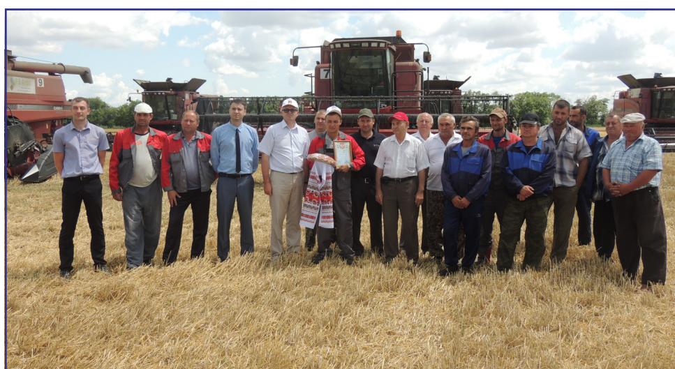
Награждение в ОАО «Конный завод имени Первой Конной Армии».