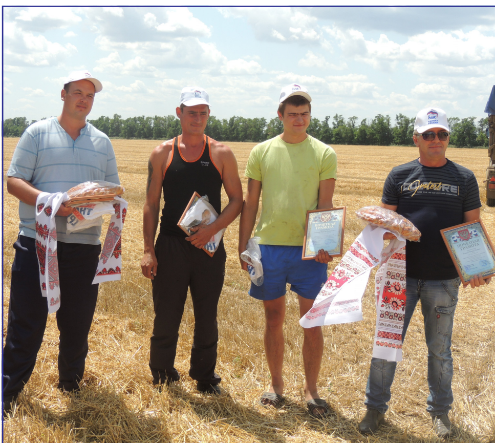
Награждение в ООО «имени Литунова».