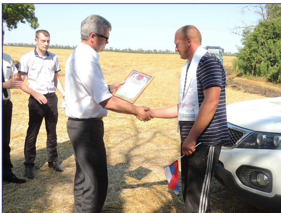
Награждение в ФГУП «Экспериментальное».