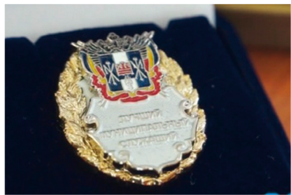
совместный выпуск правительства Ростовской области и нашей газеты

Стартовал и еще один конкурс: на звание лучшего муниципального служащего года. В этом году конкурс проводится по новому графику. Собрать документы на участие нужно уже сейчас, а финал состоится в ноябре. В ходе конкурса будут проверены знания и умения, оценен культурный и профессиональный уровень управленцев на местах.