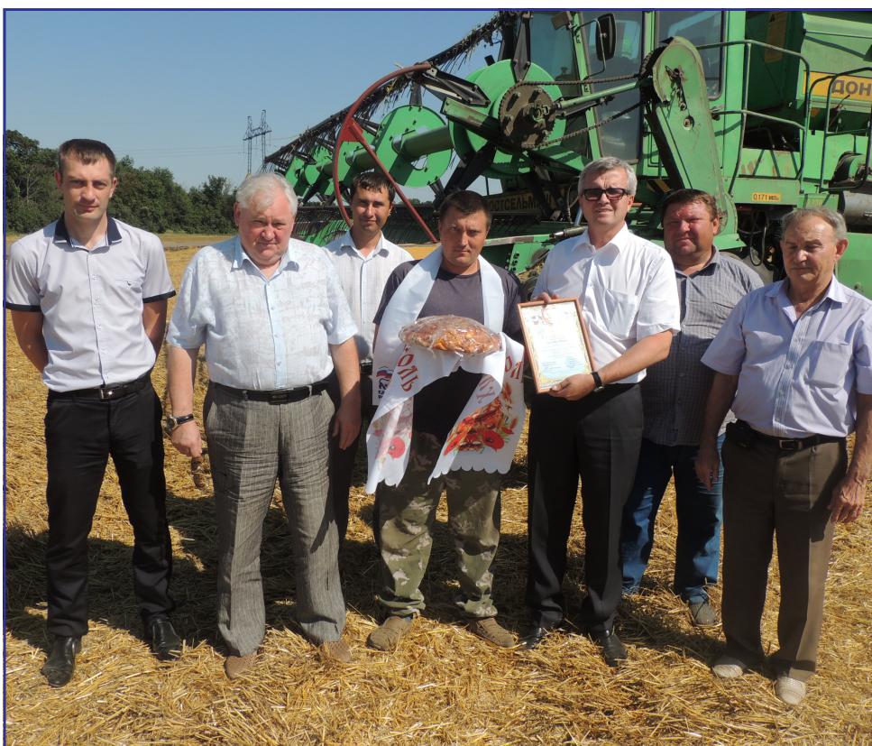
Награждение в «ФГБУ ВНИИЗК им. И.Г.Калиненко».