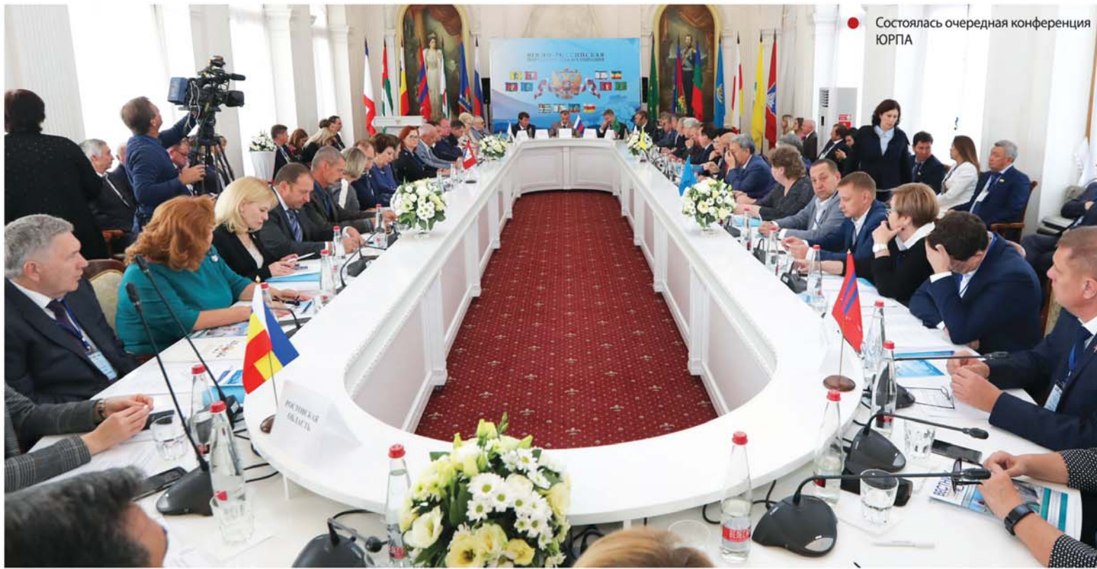
Состоялась очередная конференция ЮРПА

считают на Дону, необходимо ужесточать. Иначе с «наркобедой» обществу не справиться.