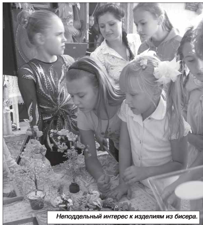
Неподдельный интерес к изделиям из бисера.

Здесь была представлена выставка изделий из бисера, детских поделок, которые пользовались большой популярностью у зрителей и участников концерта. Ребята исполняли задорные песни, танцевали, демонстрировали чудеса гибкости и пластики, а также свою фантазию. Под громкие несмолкающие аплодисменты девочки устроили настоящий показ мод в необычных нарядах, сделанных из ... разноцветных полиэтиленовых пакетов, фольги и конфетных фантиков.