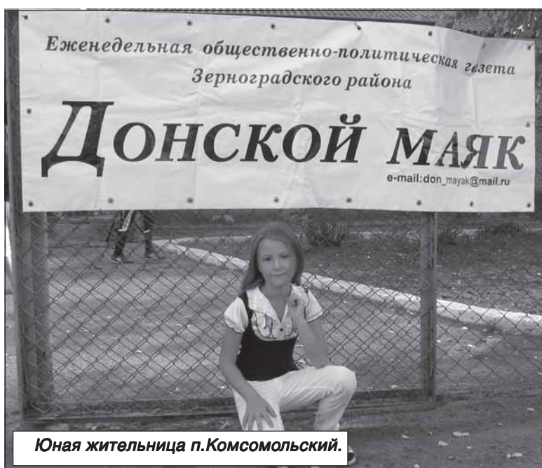
Юная жительница п.Комсомольский.

З вонкие детские голоса, веселые песни и смех, молодые мамочки с колясками, бабушки, дедушки и море творчества. Все это – концерт художественной самодеятельности, посвященный 75-летию Ростовской области, который прошел в пос.Комсомольский Зерноградского городского поселения 16 сентября. Его организовало МБУК «Комсомольский Дом культуры и клубы» (директор Л.А.Родина).