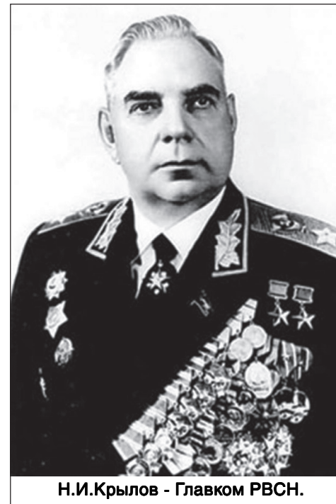
Н.И.Крылов - Главком РВСН.

Сразу после взятия Кенигсберга, когда наши войска готовились к штурму Берлина, 5-я армия была тайно погружена в эшелоны и направилась на Восток. В Москве в Ставке ВГК Николай Иванович получил подробные инструкции - его 5-я армия должна быть на направлении главного удара. Вся информация - устно, без права передачи третьим лицам. По прибытии в район дислокации армии Н. Крылов с группой офицеров штаба, командиров дивизий и полков пешком, на лошадях, на самолете осмотрели участок будущих боевых действий армии. Это хребет Большой Хинган, за которым находились 3-я и 5-я армии Квантунской армии Японии. Предстояло взять штурмом прекрасно укрепленный рубеж, причем в минимальные сроки и с минимальными потерями, выйти в район г. Муданьцзян и овладеть им. Согласно имевшимся данным, через хребет в нескольких местах были пробиты тоннели с хорошими дорогами. Но все дороги и перевалы были заминированы. Во всех тоннелях имелись артиллерийские точки. Пушки были на рельсах и в случае артобстрела или налета нашей авиации они откатывались вглубь тоннеля и не могли быть уничтожены. После, когда пошла пехота, пушки выкатываются на исходные позиции и бьют по наступающим. Вдоль хребта тоже был тоннель, по которому японцы доставляли на каждую точку боезапас и свежие силы. Кроме того, в случае необходимости они всегда могли взорвать всю систему обороны заранее заложен-