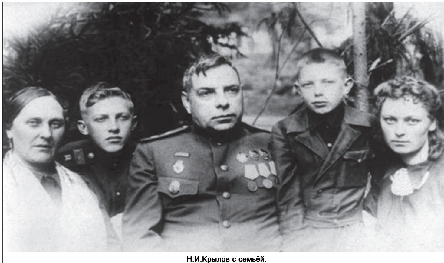
Н.И.Крылов с семьёй.

ной взрывчаткой и не пропустить наши войска через горы. Николай Иванович пришел к выводу, что при налёте авиации, артподготовке и последующем штурме «в лоб» результата не будет. Тем более, что в частях было молодое пополнение, в основном, 1927 года рождения. Он разработал свой план операции: отобрать по лагерям, расположенным в ближайших районах сибирской тайги, около двух тысяч человек, осуждённых за не слишком крупные военные преступления - пьянки, мародёрство и пр., сопутствующие быстрому продвижению по захваченной у врага территории. Большинство таких заключённых имели солидный боевой опыт. Предстояло сформировать из них ударный батальон, вооружив их только ножами, чтобы они могли тихо без единого выстрела снять охрану тоннелей, не допустив их подрыва. Сразу оговаривалось, что в случае успеха всем будут выданы чистые документы, отличившиеся получат награды, погибшим - воинские почести, как погибшим за Родину. Этот план и был одобрен маршалу Советского Союза А.М.Василевскому в личной беседе «с глазу на глаз». Василевский сам принять решение не смог, но разрешил обратиться к Сталину. Сталин дал согласие, попросив только не брать политзаключённых и предателей, добровольно перешедших на сторону врага. А. Василевский, выслушав подробный разговор Крылова со Сталиным, задумчиво спросил: «Николай Иванович, у тебя брючный ремень достаточно крепкий?». «Конечно. А почему такой вопрос?». «Потому что в случае провала тебе придется искать, на чём повеситься».