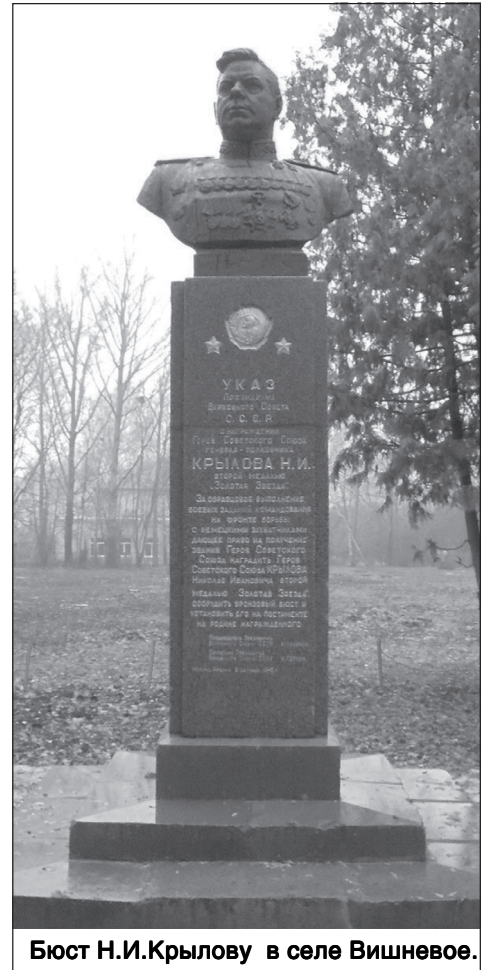
Бюст Н.И.Крылову в селе Вишневое.

Умер Николай Иванович Крылов 9 февраля 1972 г. Похоронен в Москве на Красной площади, урна с его прахом установлена в Кремлевской стене. Заслуги Николая Ивановича были высоко оценены Родиной. Дважды Герой Советского Союза, награжден 4-мя орденами Ленина, 4-мя орденами Красного Знамени, орденами Суворова и Кутузова 1-й степени, орденом Октябрьской Революции, медаля-