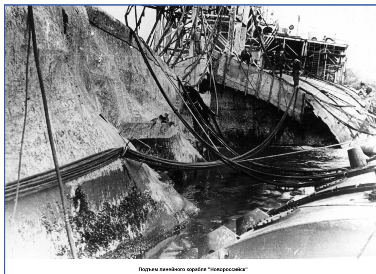
Подъем линейного корабля «Новороссийск»