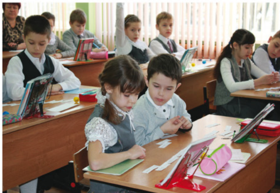
Учебные нагрузки, как считают эксперты, должны соответствовать возрасту и наклонностям детей

– В семьях с высоким образовательным цензом и материальным достатком жесткость требований к детям гораздо выше. Они должны соответствовать уровню притязаний родителей,