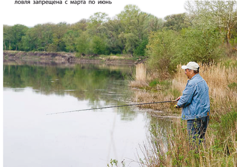
● И назвал водоемы, где рыбная ловля запрещена с марта по июнь

Премьер-министр РФ Дмитрий Медведев наградил