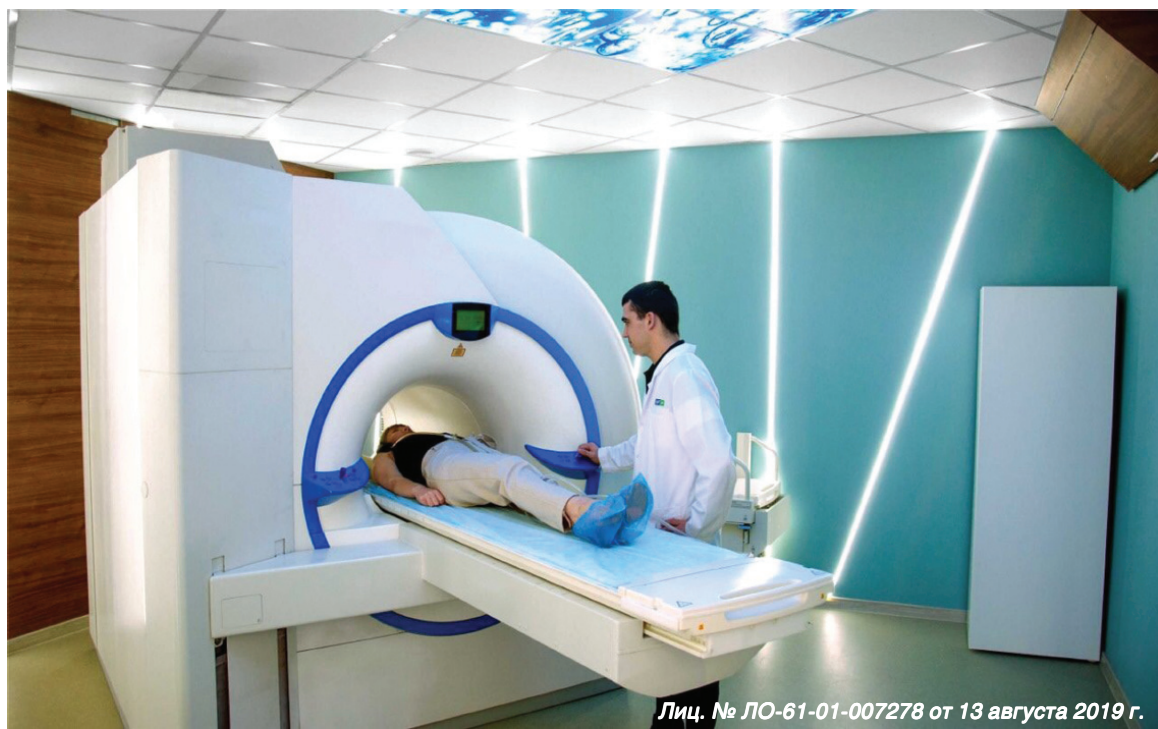
Лиц. № ЛО-61-01-007278 от 13 августа 2019 г.

-УЗИ-диагностика проводится на оборудовании экспертного класса; -имеется физиотерапевти-