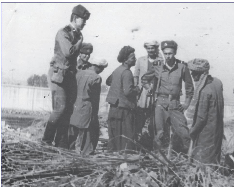
Встреча с местным населением.