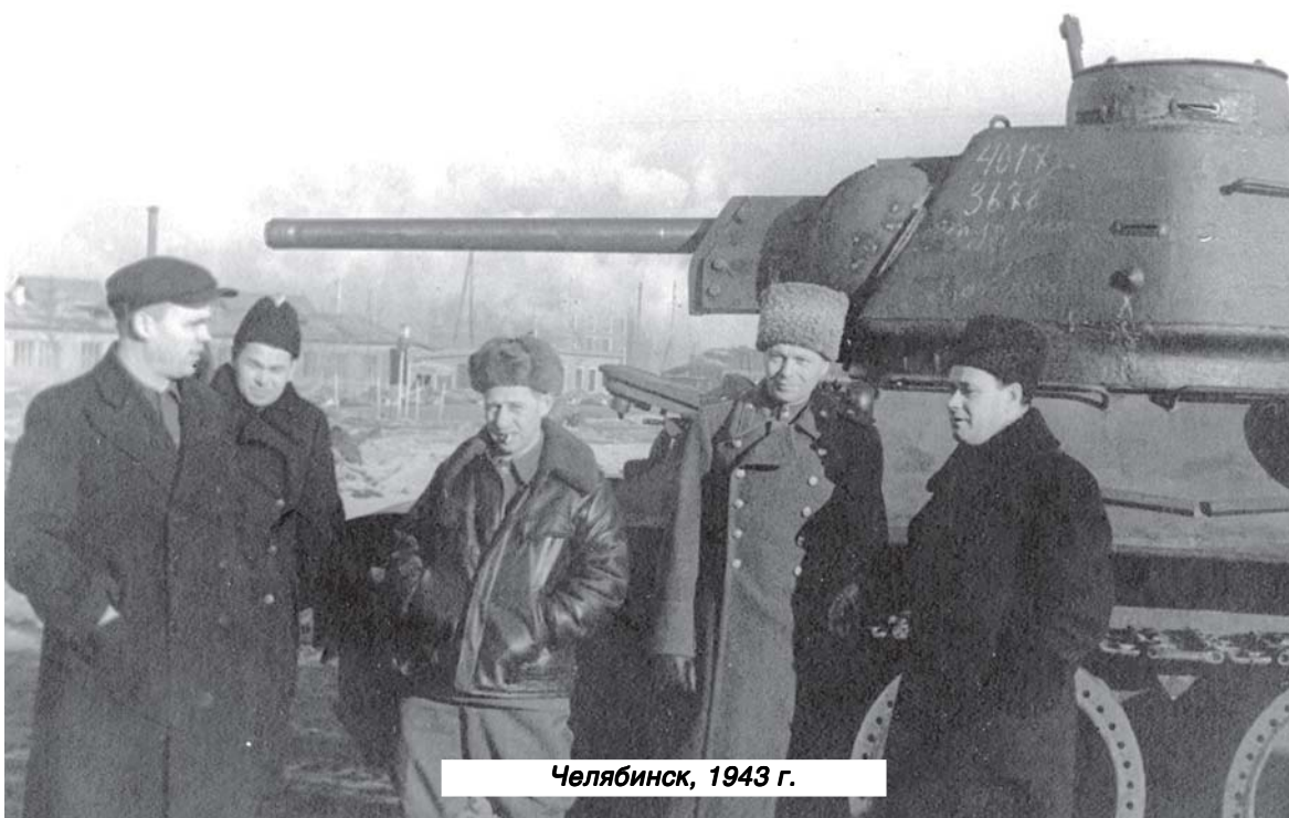
Челябинск, 1943 г.