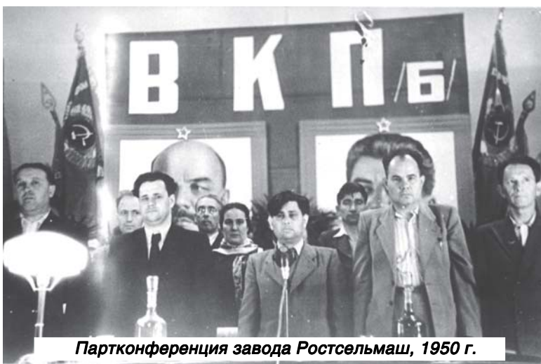
Партконференция завода Ростсельмаш, 1950 г.

О том, что Н. Патолитчев вникал в быт ростовчан, в вопросы снабжения и обслуживания населения, свидетельствует весьма показательная и забавная история. Никому еще не известный в лицо новый глава обкома партии зашел в один из продуктовых магазинов. Оглядев полупустые полки, он попросил продавщицу отпустить полкилограмма макарон. Та обозвала его «интеллигентом в шляпе» и заявила, что оберточной бумаги нет.