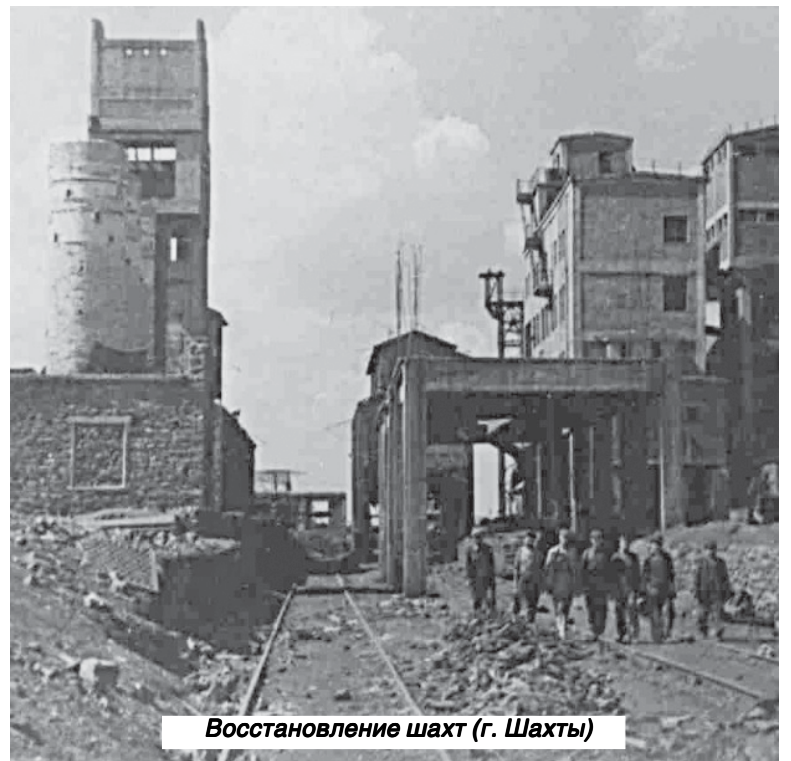
Восстановление шахт (г. Шахты)