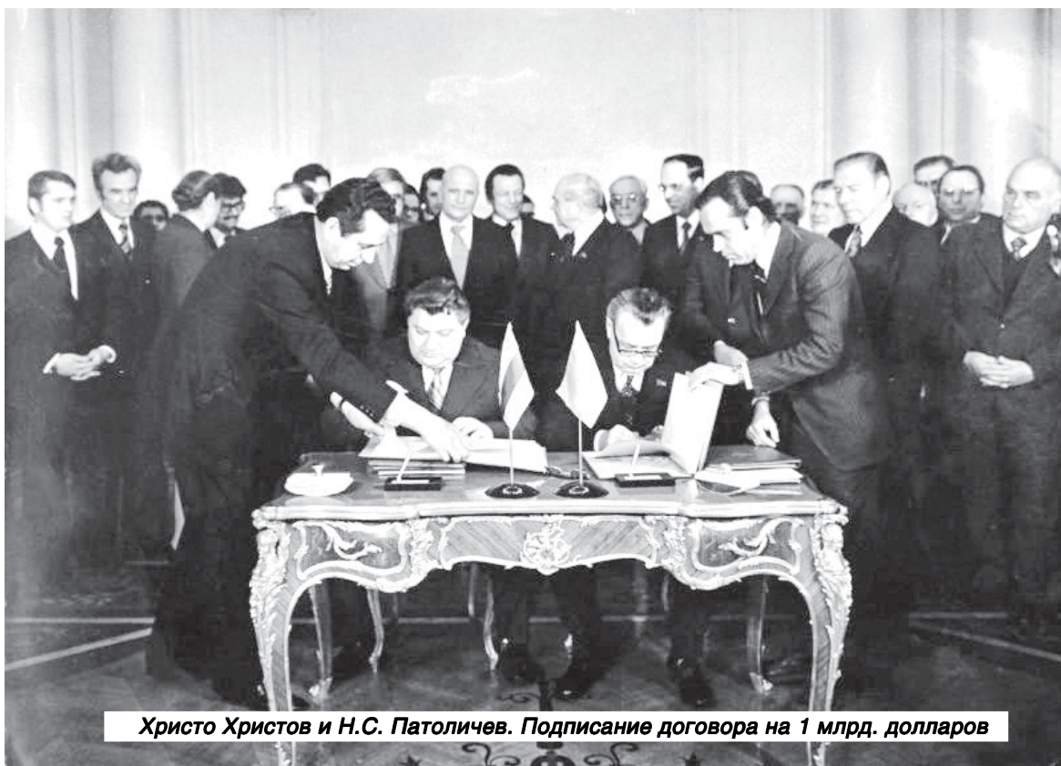
Христо Христов и Н.С. Патолитчев. Подписание договора на 1 млрд. долларов

ве внедрения передовых зарубежных достижений. В содружестве с зарубежными компаниями на базе комплексного импортного оборудования открылись более 5 тыс. предприятий. Это Волжский автомобильный завод, КАМАЗ, 7 шинных заводов, Западно-Сибирский комплекс заводов по переработке попутного нефтяного газа, Томский нефтехимический комплекс, комплекс по производству полиэфирных волокон, Норильский горно-металлургический комплекс, Светлогорский бумажно-целлюлозный комбинат, Оскольский электро-металлургический комбинат, Саянский алюминиевый комплекс и многие другие предприятия. Всего не перечислить. Внешторг продвигал отечественные товары на мировые рынки. Например, экспорт легковых автомобилей из СССР составлял более 300 тыс. в год. Заметно возросли физические объёмы продажи чёрных и цвет-