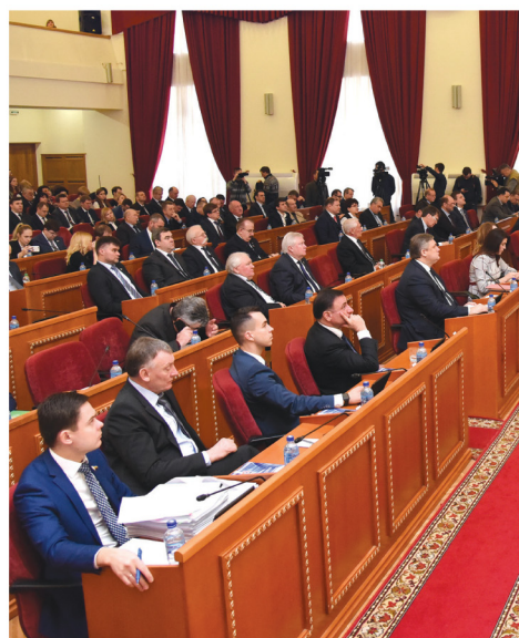
Состоялось внеочередное заседание Законодательного Собрания Ростовской области

В процессе мониторинга закона была выявлена проблема, с которой сталкиваются органы местного самоуправления. Она связана с установлением границ прилегающих территорий. Зачастую муниципалитетам не хватает средств для проведения необходимых кадастровых работ. В связи с этим в Ростовской области отсутствует правоприменительная практика привлечения к административной ответственности собственников зданий и сооружений, не участвующих в благоустройстве прилегающих территорий. И если предусмотреть законом упрощение порядка определения границ прилегающих территорий, то станут очевидны и наказуемы нарушители правил благоустройства.