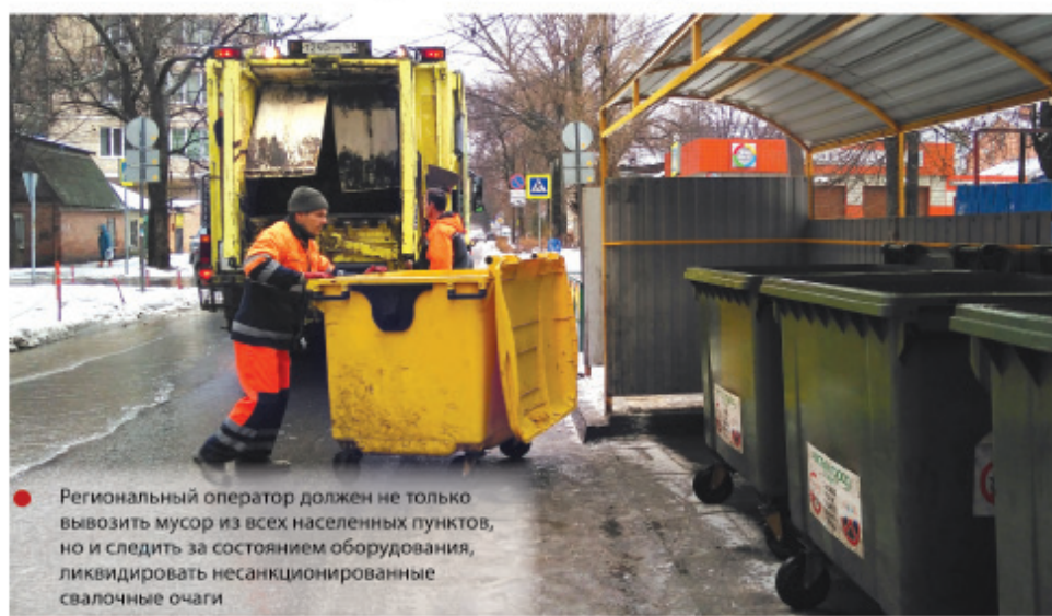
Региональный оператор должен не только вывозить мусор из всех населенных пунктов, но и следить за состоянием оборудования, ликвидировать несанкционированные свалочные очаги

– Механизм понятен и довольно прост. Тариф нужно умножить на норматив на-