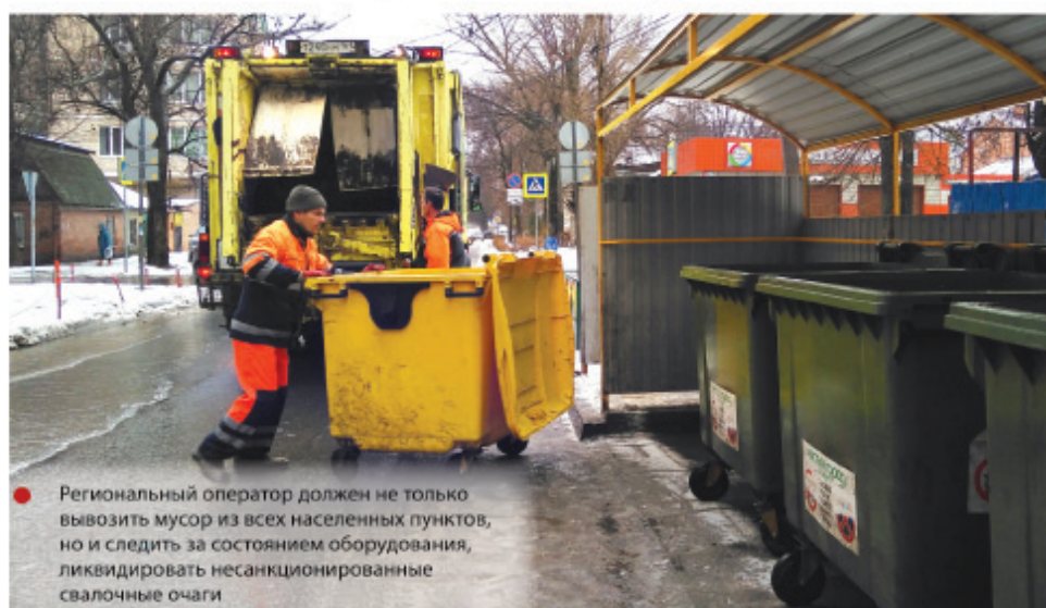
Региональный оператор должен не только вывозить мусор из всех населенных пунктов, но и следить за состоянием оборудования, ликвидировать несанкционированные свалочные очаги

– Механизм понятен и довольно прост. Тариф нужно умножить на норматив на-